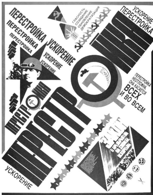
Плакат демократической революции.

Для разделяющих эту политическую идею каждый человек обладает точно таким же объемом прав, как и любой другой.