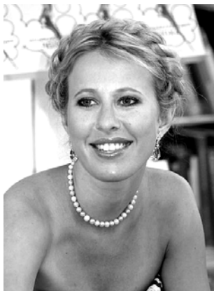
К.А.Собчак. 2009.

вуз, как организовала сверстников на борьбу с режимом. В подпольной студенческой группе юношество обсуждало не любовные интрижки, а необходимость свержения коммунистической диктатуры путём вооружённого восстания! В семидесятые годы В.Новодворскую лечили от антикратии в психиатрической лечебнице, судили за диссидентскую деятельность. Ссорилась она с Горбачевым, поздним Ельциным, с Путиным. Настоящая бунтовщица!