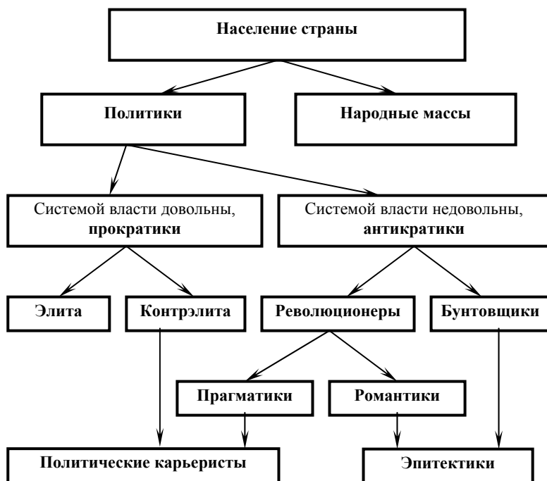
Рис.1. Схема политической классификации населения

Среди прократиков доминирует элита . Это государственные деятели, которые занимают определенные должности, их дети, родственники, близкие, даже иногда просто приятели, которые получают выгоду от пребывания их друга на государственной должности. Высшая и наиболее заметная часть элиты – истэблшмент – лицо государства. Странники конспирологических идей предполагают, что элитарии получают управленческие сигналы из некоего центра и действуют так или иначе именно под воздействием подобных внешних сигналов. Мы с таким конспирологическим подходом не согласны. Мы считаем, что специального центра не существует, и элитарии действуют так или иначе, исключительно исходя из собственных интересов, из своих представлений о том, что хорошо и что плохо. Но, поскольку представления об этом у элитариев из разных стран довольно схожие, то и действуют они, обычно, шаблонно.