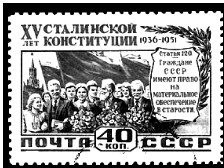
Почтовая марка СССР. Увеличено.

В разных странах группа лиц (элита) организует себе преимущество на разных этапах формирования представительного органа власти. Наиболее заметно мухление на этапе агитации. Обсуждение мухления на этом этапе – кость, специально бросаема бунтовщикам