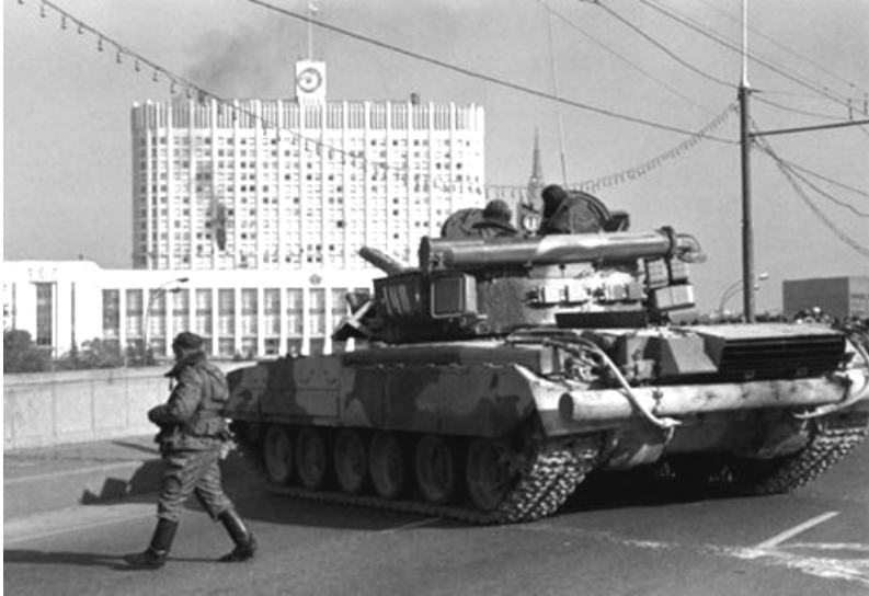
Танк у здания ВС России. 4 октября 1993 года.