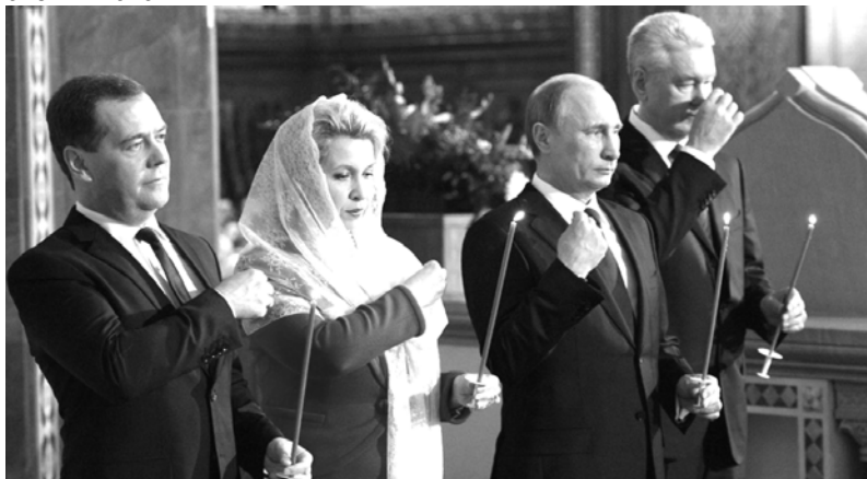
Россия. Москва. 5 мая 2013 г. Премьер-министр РФ Д.Медведев с супругой, президент РФ В.Путин и мэр Москвы С.Собянин (слева направо) на пасхальном богослужении в Храме Христа Спасителя.

Если исходить из идеи государства – инструмента по организации справедливого сосуществования людей, если поставить себе задачу построить эффективный инструмент для организации сосуществования, революция или реформа может и получиться. Тогда становится очевидным, что главный вопрос реформы/революции это вопрос о том, каким же должен быть этот инструмент – государство . Ни накануне революции, ни в ходе революции широкого общественного обсуждения оптимального инструмента – государства так и не состоялось. Не обсуждается этот важнейший вопрос и сейчас. Это очень плохо!