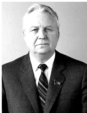
Е.К.Лигачев. 1993.

Мы также отказываемся искать всякого рода внешних «руководителей» и сделаем попытку объяснить, в чем мы видим смысл, причины, и каковы движущие силы последней по времени революции, приведшей к распаду СССР и образованию суверенных государств с несоциалистическим общественным устройством. Мы будем искать объективные причины революции в интересах людей, ибо, по нашему мнению, людьми двигают интересы.