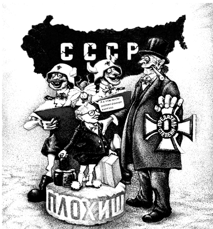
Е.Кочетков. Плакат «Финиш перестройки». Сайт caricatura.ru

ни с того, ни с сего, враги востребовали деньги назад. Отдать же долги, скорее всего, помешало снижение мировых цен на нефтепродукты! Наверное, именно эти «враги» наняли тысячи демонстрантов, пообещав им по банке варенья и по корзинке печенья? Эти подкупленные советские «плохиши» и совершили революцию.