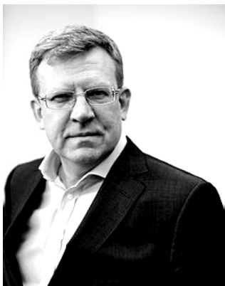
А.Л.Кудрин. 2011.

Антагонист элиты – контрэлита – это такие прократики, которые хотя и довольны системой власти, но не удовлетворены своим положением в этой системе. И, может быть, даже своим отсутствием на каком-либо месте в этой системе. Заместитель министра, вероятно, хотел бы стать министром, активист политической партии мечтает стать депутатом или главой районной администрации, то есть занять определенное место в существующей государственной иерархии.