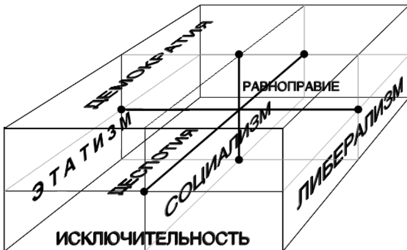
Рис. 4. Пространство политических идей

пространства. Мы предлагаем сгруппировать политические идеи не по одной оси: левые – правые, а вокруг трех осей, то есть в некоем объеме, пространстве (рис. 4).