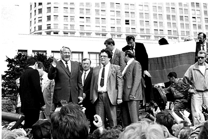
Б.Ельцин на танке напротив здания ВС РСФСР 19 августа 1991 г. обращается к толпе сторонников со своим заявлением о незаконности действий ГКЧП.

Давайте спокойно и беспристрастно посмотрим назад, на период с 1985 года по август 1991 года. Решая свои задачи, политические карьеристы вынуждены были улучшать жизнь народа, двигать страну в правильном направлении в политическом пространстве. До августа так и было. Почему? Потому, что сопротивление КПСС этим переменам требовало от политических карьеристов искать себе союзников. Без союзников они КПСС свалить не смогли бы.