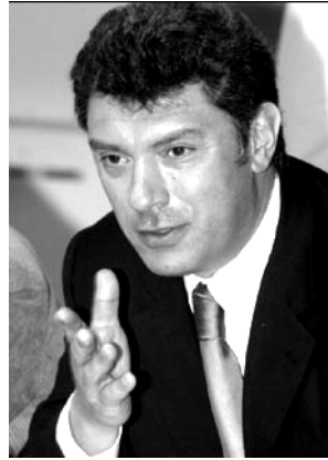
Б.Е.Немцов. 2009.

Революционеры, в отличие от бунтовщиков, ставят вполне определенные цели: вместо монархии – буржуазная республика, и тогда будет хорошо, а мы получим возможность избираться депутатами парламентов всех уровней. Другие революционеры говорят: капитализм устарел, давайте строить социализм, который ближе русскому коллективистско-общинному духу, а мы тогда станем народными комиссарами, и это будет хорошо. Таким образом, революционеры декларируют свое видение будущего иного государственного уст-