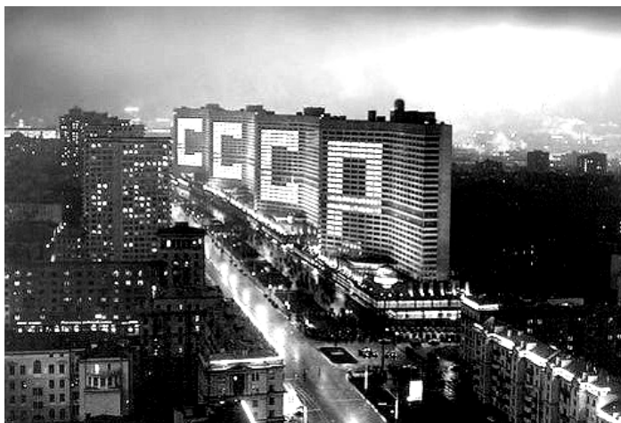
Москва. Иллюминация на пр. Калинина (Арбат) 7 ноября.

И далее Н.Рыжков делает вывод: «Именно идея социальной справедливости была и остается наиглавнейшей русской духовной традицией. Сегодня она, как и многие другие лучшие качества советского человека, не в чести у тех, кто формирует нравственный климат в обществе».