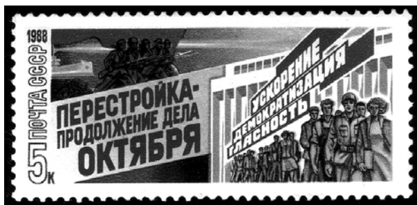
Почтовая марка СССР периода «перестройки». Увеличено.

Таким образом, даже на уровне лозунгов-идей – консервативно настроенная элита и сторонники либерализации в Советском Союзе в конце 80-х годов XX века подсовывали обществу ложную оппозицию, такую оппозицию, которая не имеет позитивного разрешения. Победил тезис: Разрешено все, что не запрещено. Результаты этой победы мы сейчас и расхлебываем.