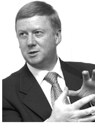
А.Б.Чубайс. 2005.